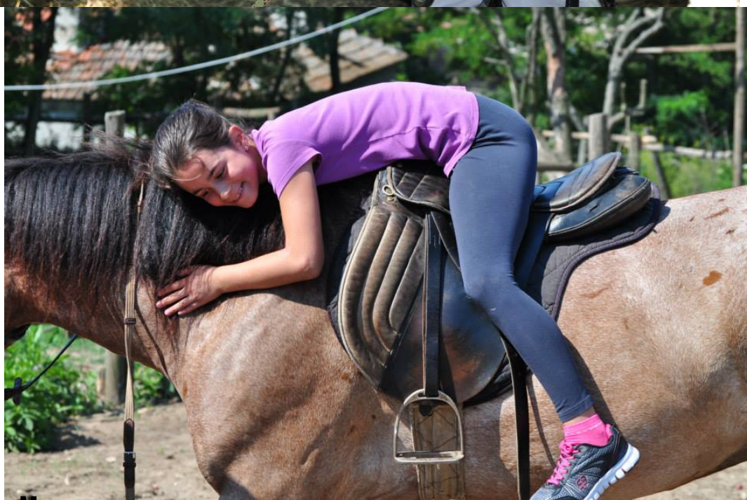
Местоположение на мястото на среща на приключенското училище